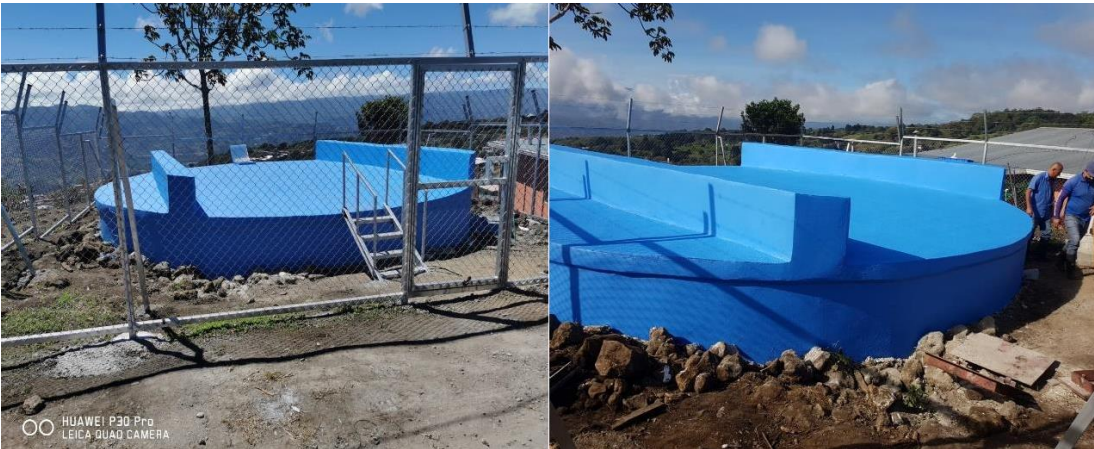
214 Fotos N°21 y N°22

211 Tanque Matías Solano, se construyeron cajas para el resguardo de equipos de 212 control a la salida de los tanques, entre los equipos válvulas liberadores de aire, 213 llaves de control y los macro medidores.