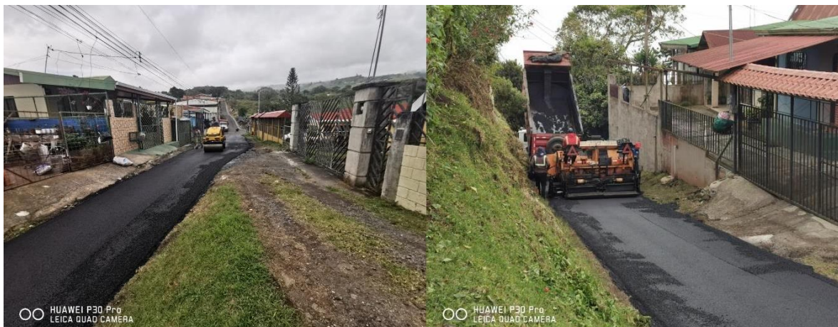
313 Foto N°43 y N°44 314 Camino Las Cumbres