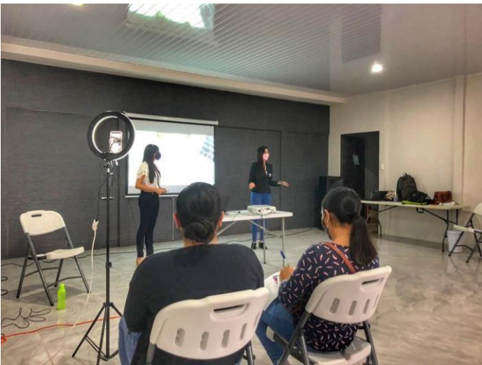
398 Foto N°51 399 Red de Mujeres Cervantes- talleres sobre emprendimiento abiertos a la 400 comunidad