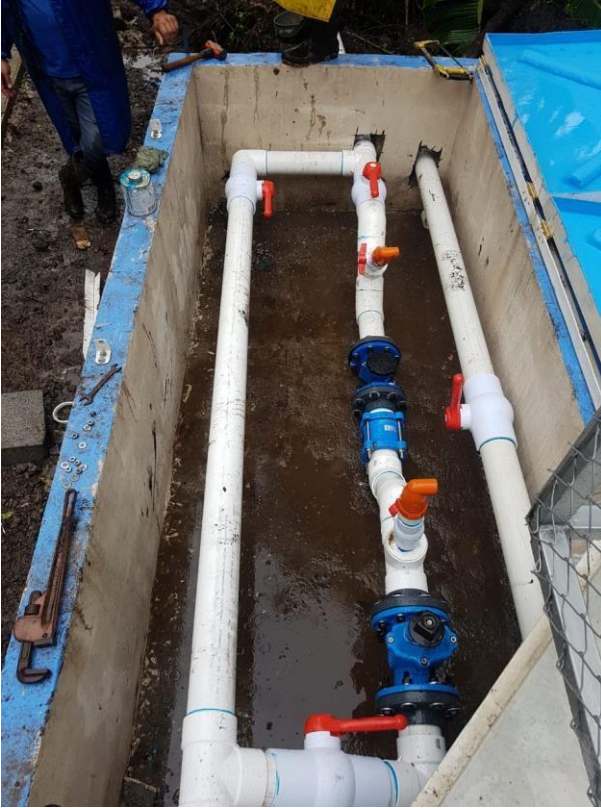
210 Foto N°20

211 Tanque Matías Solano, se construyeron cajas para el resguardo de equipos de 212 control a la salida de los tanques, entre los equipos válvulas liberadores de aire, 213 llaves de control y los macro medidores.