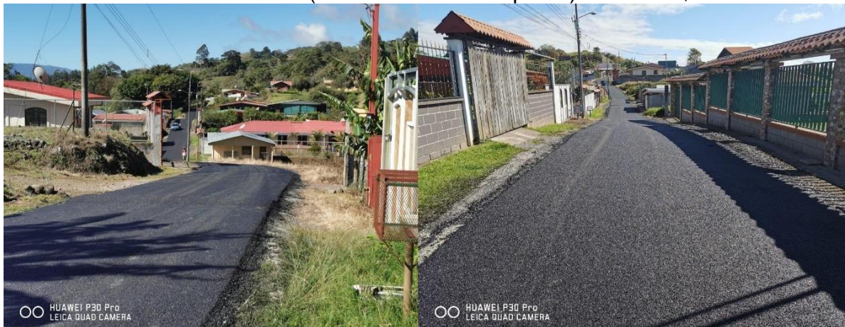
309 Foto N°41 y N°42 310 Camino Calle Ulloa 311 Distancia intervenida 280m (4m ancho x 5cm espesor) Inversión ¢6.967.240 312