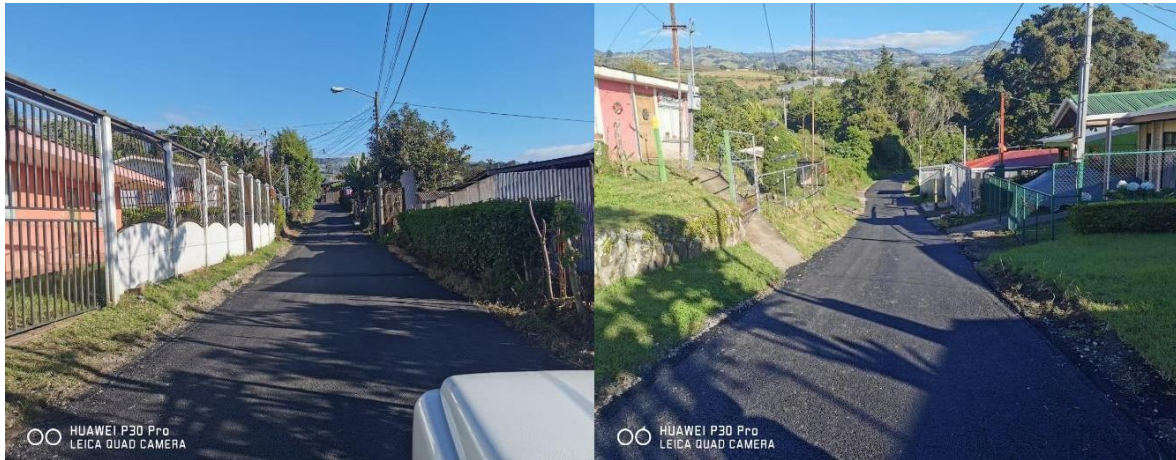
306 Foto N°39 y N°40 307 Camino La Hacienda 308 Distancia intervenida 320m (4m ancho x 5cm espesor) Inversión ¢7.962.560