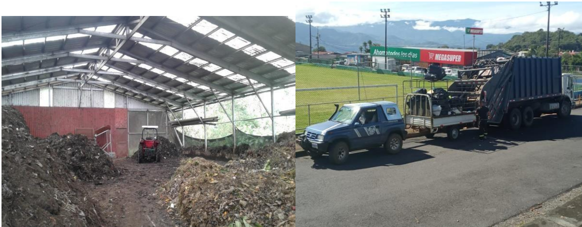
242 Fotos N°26 y N°27

243 Los desechos orgánicos producidos por la comunidad, en la actualidad reciben 244 un tratamiento para ser convertidos y reutilizados como compost orgánico. De 245 esta manera se disminuye la cantidad de residuos que llegan al relleno 246 sanitario