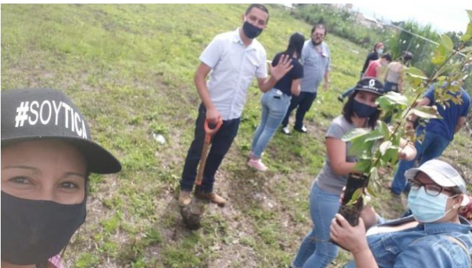
401 Foto N°52 402 Club del árbol- campaña de reforestación