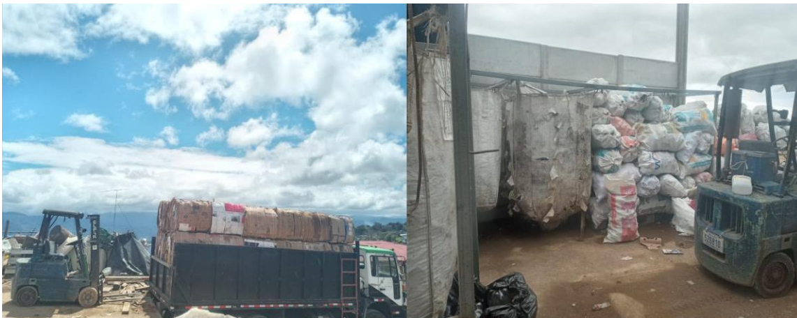
248 Fotos N°28 y N°29

249 A partir del servicio de recolección diferenciada que tiene el CMD Cervantes, los 250 desechosvalorizables son seleccionados y llevados a procesar para su reutilización.