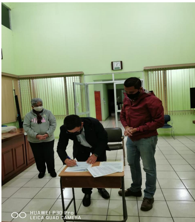
500 Foto N°65

Firma de convenio con la Escuela de Música de Cervantes