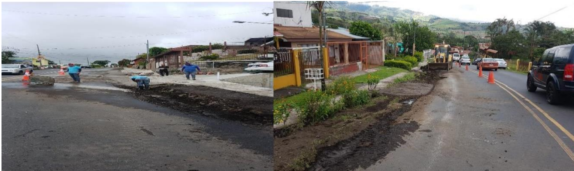
72 Fotos N°1 y N°2

73 Cambio de tuberías sector San Pancracio