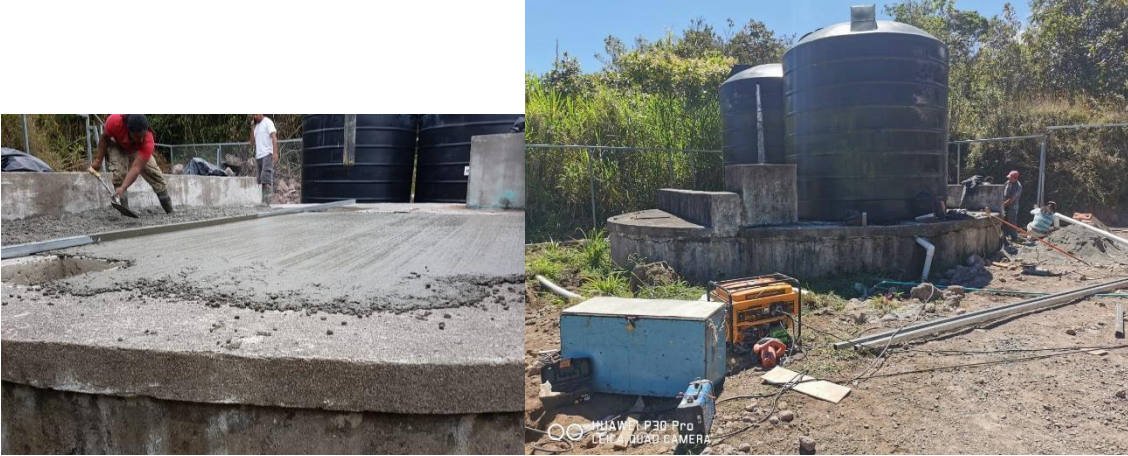
218 Fotos N°23 y N°24

219 Taque El Tajo, ya está en ejecución, se realizarán los mismos trabajos que a todos 220 los tanques del acueducto municipal.