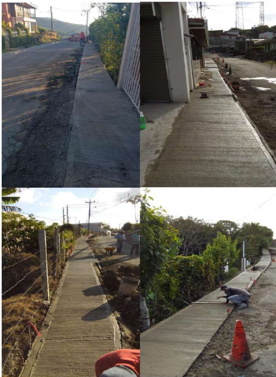
Imágenes #9, #10, #11 y #12 Construcción de aceras en el Barrio San Pancracio.