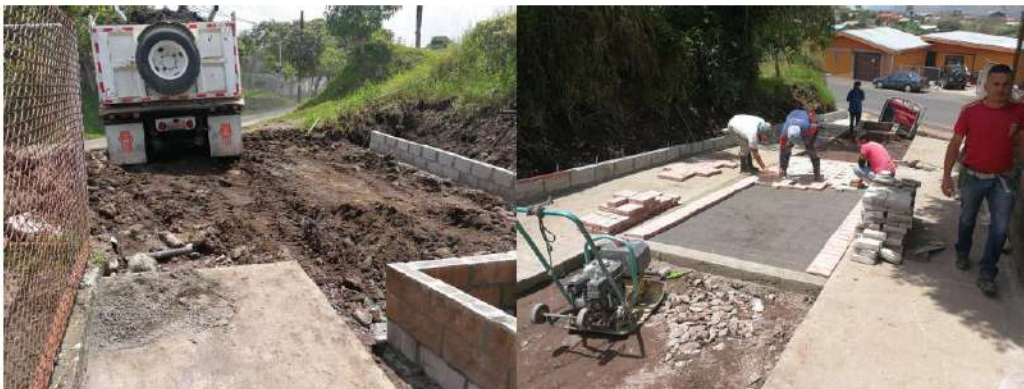
Imagen #32 y #33

En un esfuerzo por mejorar se ha dotado de equipos a la institución para garantizar un mejor desempeño.