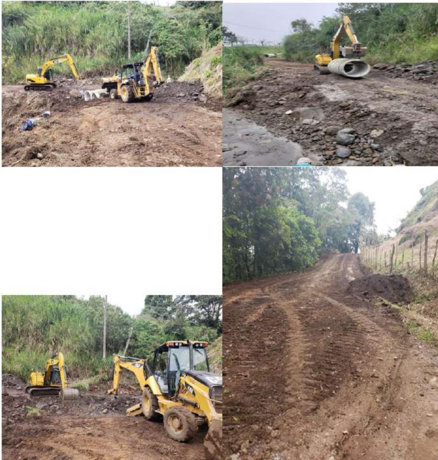
Imagen #26, #27, #28 y #29

Obras realizadas en el Camino Toro Loco - Las Aguas, intervención que constituyo limpieza de vía, conformación, construcción de vados, canalización de aguas, cabezales. Camino que beneficia a muchos productores de la zona alta.