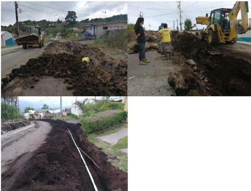
Imagen #2, #3 y #4

Lote donde se ubica el Tanque de almacenamiento Manuel Ulloa, principal tanque del Sistema del centro de Cervantes y que ahora es propiedad del CMD Cervantes.