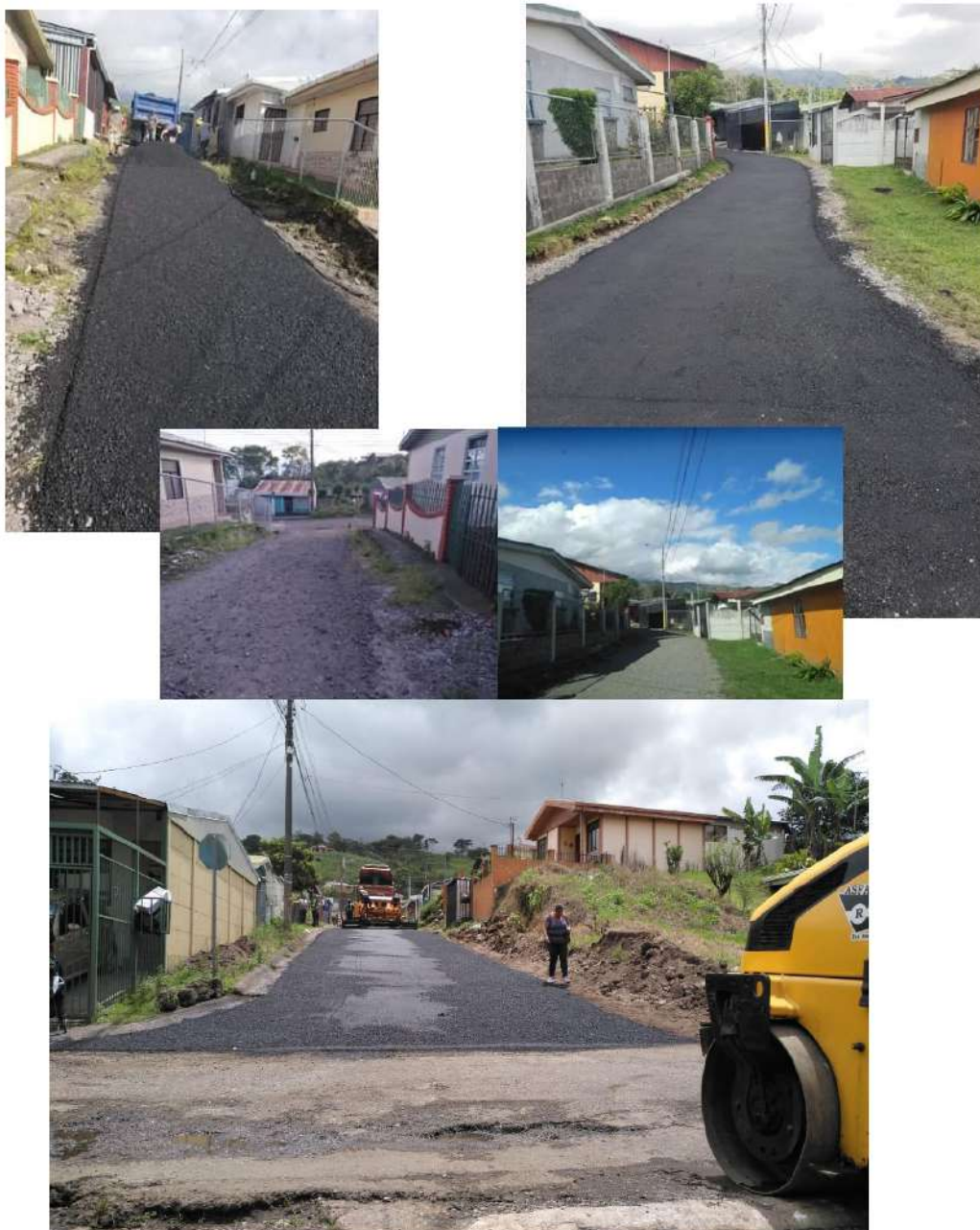
Imágenes #13, #14 y #15

Obras de asfaltado en Barrio La Esperanza, incluye ampliación y asfaltado de la entrada principal y asfaltado de las alamedas