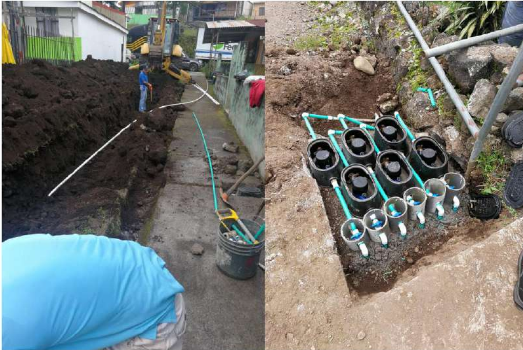
Imagen #5 Obras de instalación de medidores en diferentes barrios de Cervantes, 608 unidades colocadas en la primera etapa.