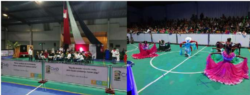
Imagen #36 y #37

Actividad cultural "Show de talentos", presentación de personas de la comunicad. Evento organizado en conjunto con Juntos por Cervantes.