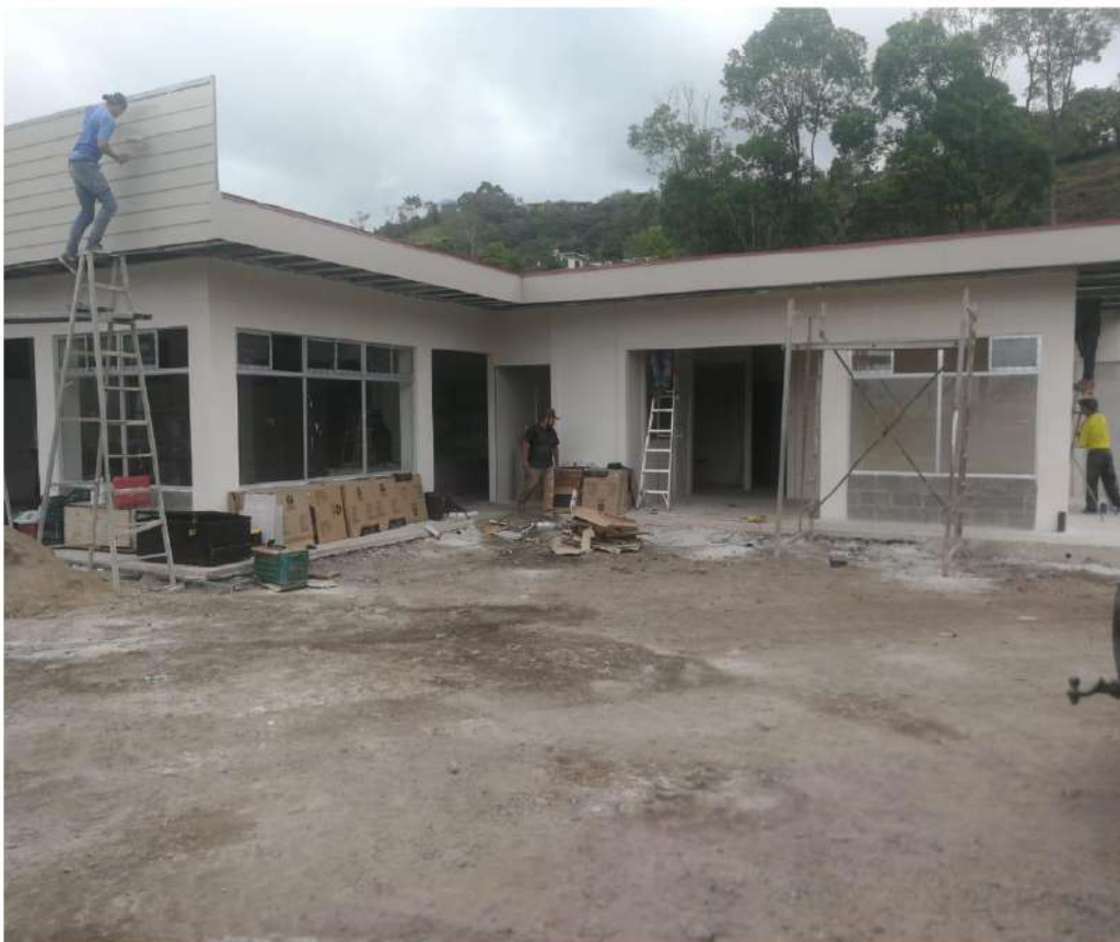
Imagen #40, #41 y #42

Construcción del Centro Cultural de Cervantes, edificio que servirá de casa para la escuela de Música del Distrito y punto de reunión y capacitación para nuestro querido pueblo.