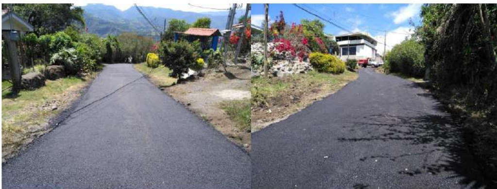
Imagen #20 y #21

Registro fotográfico del asfaltado en el camino Las Aguas, ruta alterna para salir por la ruta 230 y evitar la congestión vial en sectores como Paraíso y Cartago Centro.