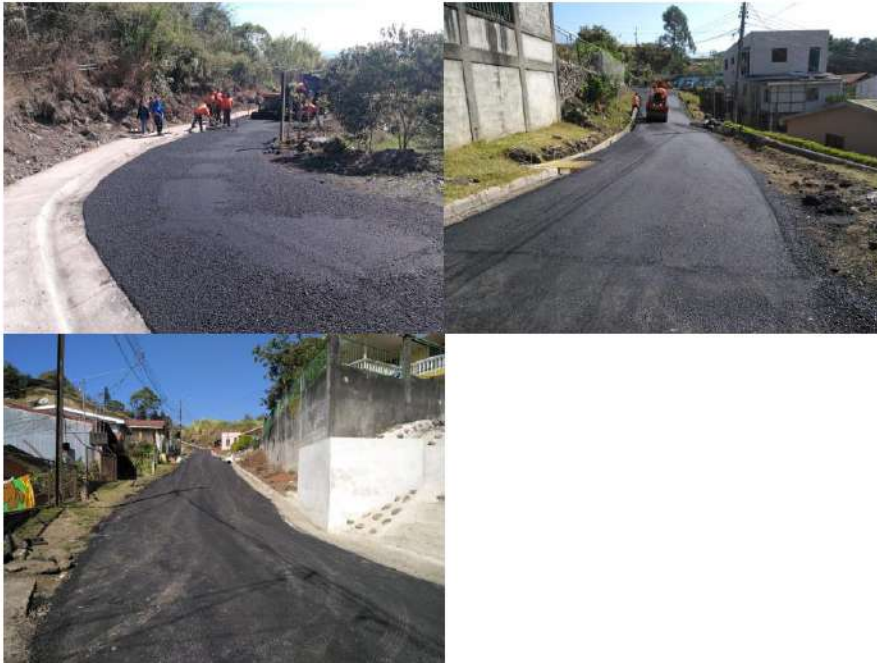
Imagen #22, #23 y #24 Proyecto de asfaltado Barrio Divino Niño