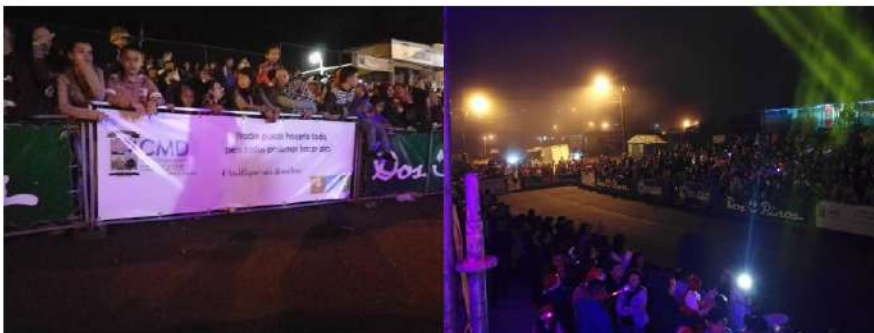
Imagen #38 y #39

Celebración de la semana cívica 2018, participación de diversas instituciones.