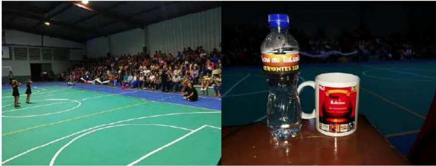
Imagen #34 y #35

Actividad cultural "Show de talentos", presentación de personas de la comunicad. Evento organizado en conjunto con Juntos por Cervantes.