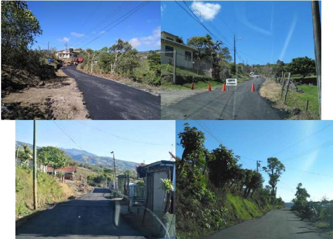
Imagen #16, #17, #18 y #19

Registro fotográfico del asfaltado en el camino Las Aguas, ruta alterna para salir por la ruta 230 y evitar la congestión vial en sectores como Paraíso y Cartago Centro.